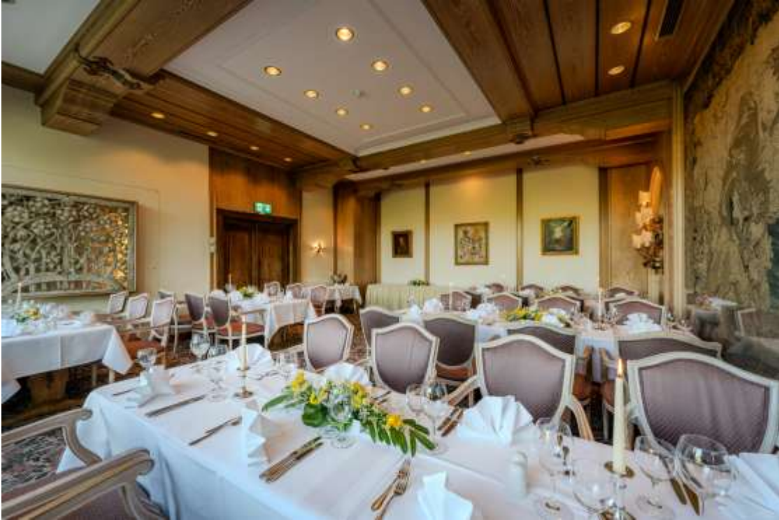
Gobelin & Restaurant

Der Raum Gobelin ist ein Veranstaltungsraum mit einem direkten Zugang zum Terrassenbereich. Bei schönem Wetter bietet es sich an, Empfänge, Kaffeepausen, Mittagessen und / oder Abendessen auf der Terrasse abzuhalten.